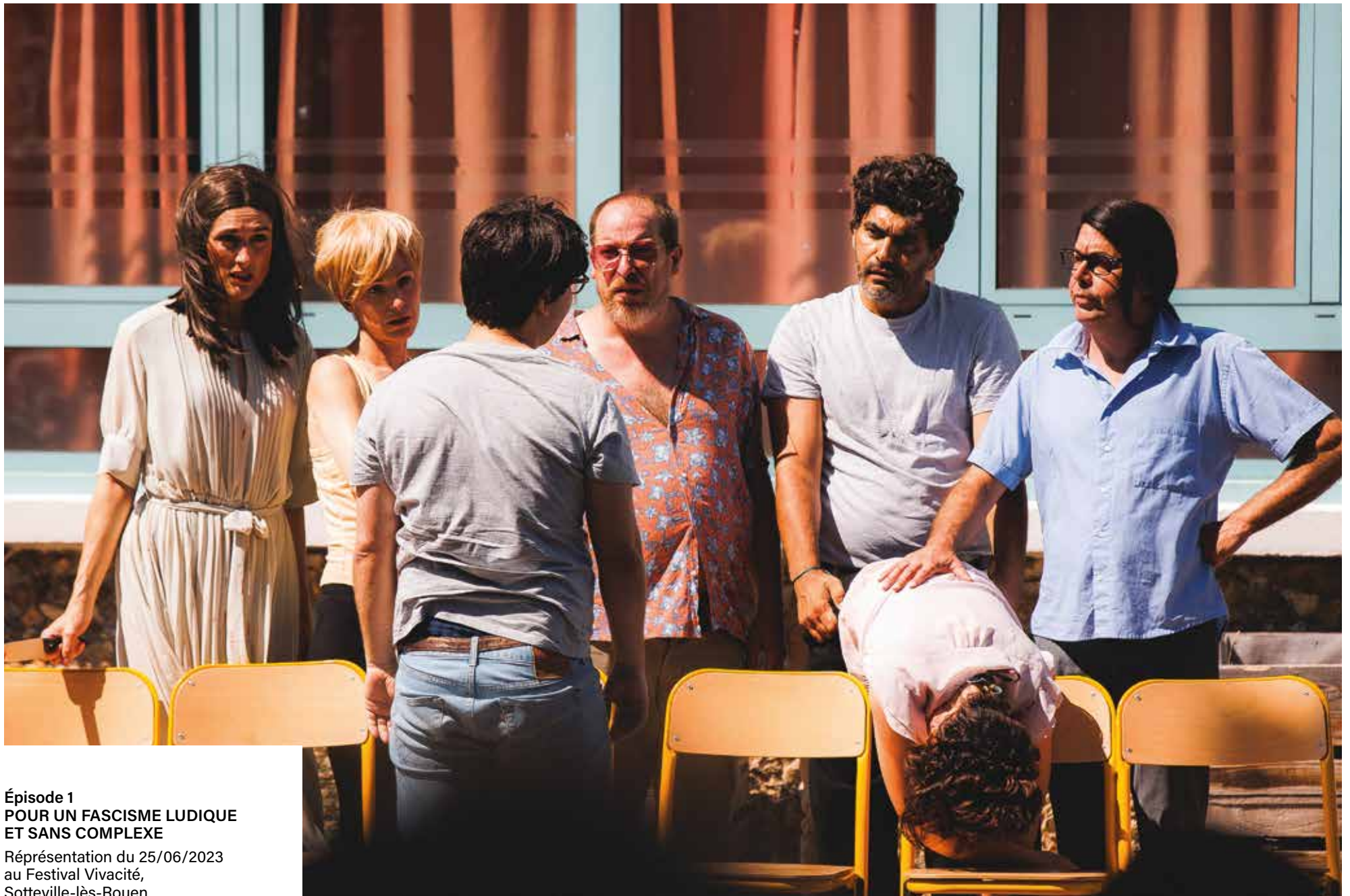
Épisode 1 POUR UN FASCISME LUDIQUÉ ET SANS COMPLEXE Représentation du 25/06/2023 au Festival Vivacité, Sotteville-lès-Rouen