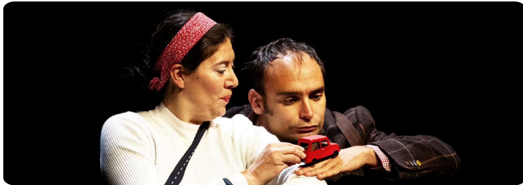
"Dans les jupes de ma mère"

Ce qui fait la singularité de la compagnie, c'est son utilisation du théâtre visuel et gestuel. Ils ont consciemment choisi de passer par une communication non-verbale afin de pouvoir laisser aux spectateurs l'espace nécessaire à leur imagination. C'est au travers de gestes et de mouvements précis que s'écrit le spectacle permettant ainsi aux spectateurs d'interpréter le spectacle à sa façon et de compléter ou moduler le propos de l'œuvre.