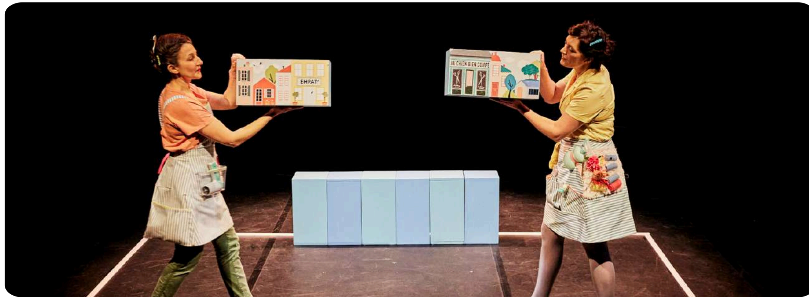
"Monologue d'un chien bien coiffé"

Pour cette pièce, la compagnie a souhaité créer un spectacle léger destiné à tout public et accessible dès 3 ans. Dans la continuité du cycle de création entamé 4 ans auparavant sur le sujet de la famille, la compagnie a décidé d'explorer la place des personnes âgées au sein de nos foyers : que faisons-nous avec nos vieux ? Comment gérons-nous la mort dans la famille ? Quelle est la place des grands-parents dans la vie de famille ?