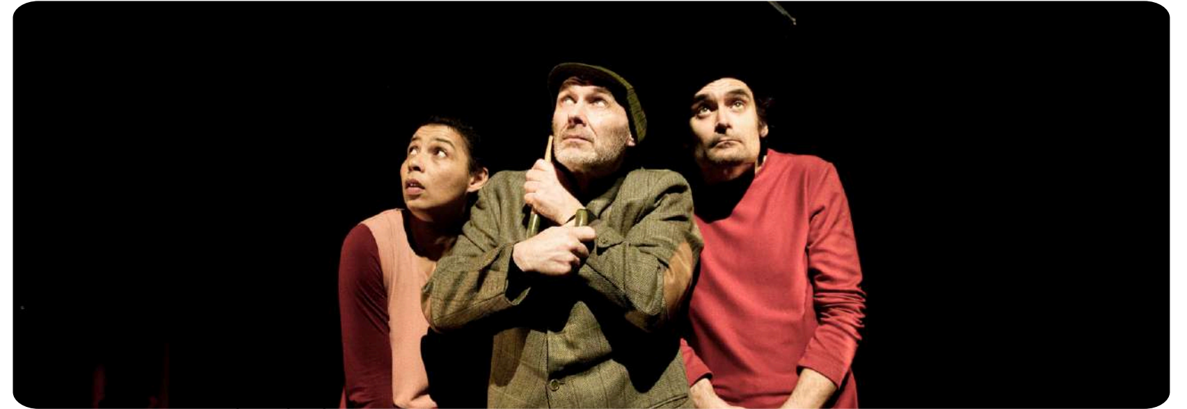
"A petits pas dans les bois"

Au fur et à mesure des années et des créations, la compagnie s'est créée son propre langage en mêlant différentes formes comme le théâtre d'objets, la marionnette, les arts plastiques mais aussi la danse et la musique. Son travail est enrichi par les différents savoirs apportés par les artistes de la compagnie. Ils pratiquent une écriture très scénique, puisque c'est l'expérimentation au plateau qui permet la rencontre et la résonance entre les différents médiums et formes utilisés.