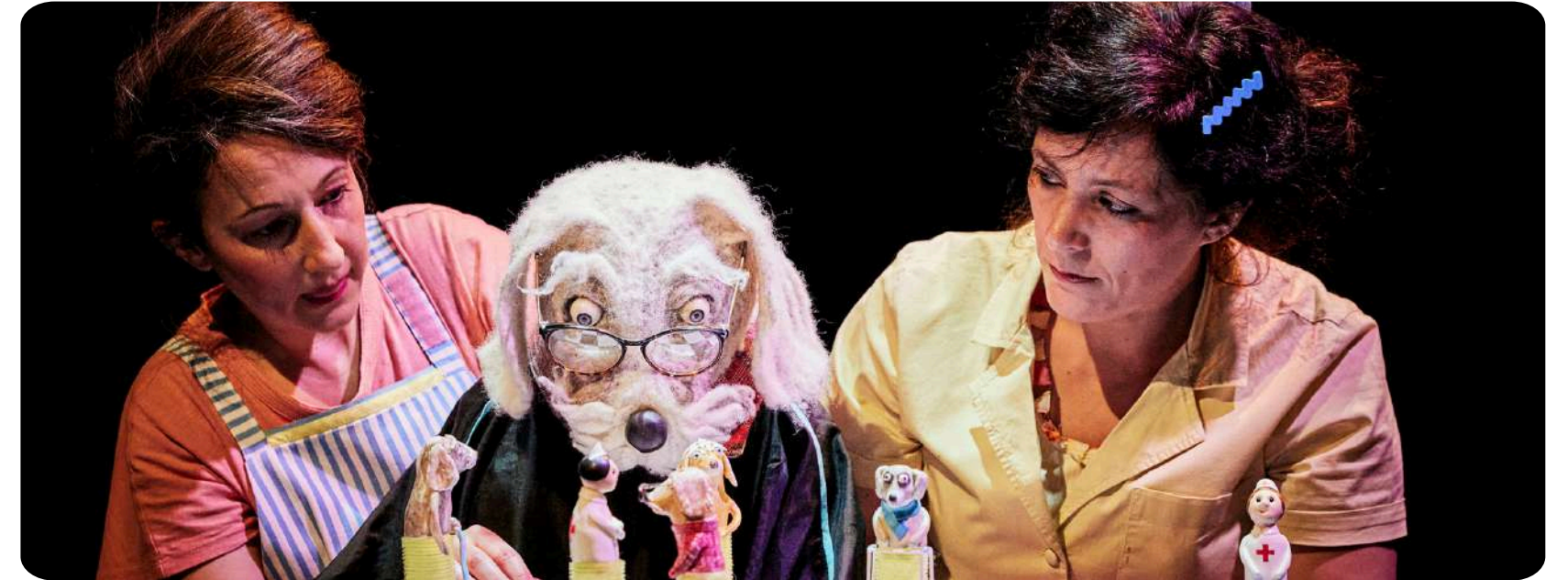
"Monologue d'un chien bien coiffé"

Par la suite ils créeront « Dans les jupes de ma mère » en 2018 puis « Les lapins aussi traînent des casseroles » en 2020.